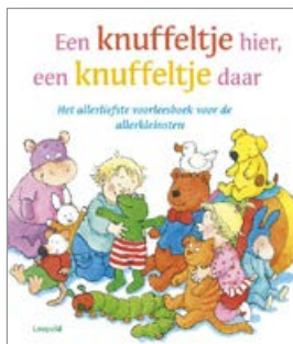
Een knuffeltje hier, een knuffeltje daar Leopold B.V. ISBN 978 90 258 6405 7

De volgende boekjes passen bij het thema 'Ik en mijn familie':