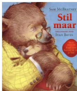
Stil maar Sam Mcbratney Veltman Uitgevers B.V. ISBN 978 90 483 08064