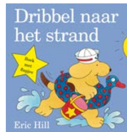
Dribbel naar het strand Eric Hill Van Holkema & Warendorf ISBN 978 90 003 3824 5