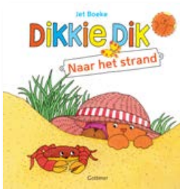
Dikkie Dik naar het strand Jet Boeke & Arthur van Norden Gottmer ISBN 978 90 257 5493 8