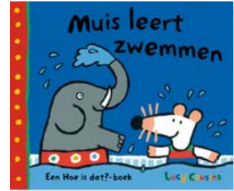
Muis leert zwemmen Lucy Cousins Leopold ISBN 978 90 258 6235 0