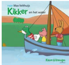
Kikker en het water Max Velthuijs Leopold ISBN 978 90 258 6648 8