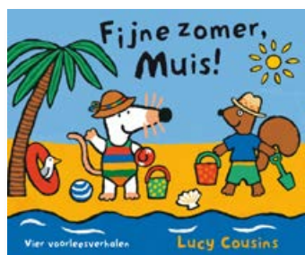
Fijne zomer, muis! Lucy Cousins Leopold ISBN: 978 90 258 6061 5